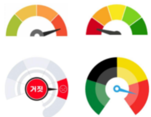
Figuur 2: waarheidsmetertjes.

In het begin werd het eindoordeel van 'Klopt dit wel' ondersteund met een waarheidsmetertje. Een hulpmiddel dat internationaal veel gebruikt wordt voor factcheckrubrieken ( Adair, 2022 ). Later is dit metertje vervangen door een samenvattende zin, omdat het metertje minder geschikt leek voor politieke factchecks (Custers, 2017).